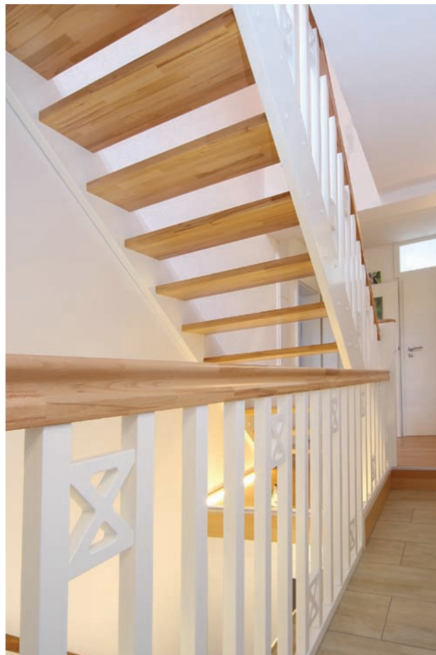
Treppe mit Charakter: Die eingestemmte Massivholzwangentreppe aus dem Hause STREGER hat einen geraden Verlauf und kombiniert verschiedene Holzarten miteinander.

das Ambiente ein und ist ein absoluter Blickfang, wobei das Geländer mit der Bezeichnung GX1 besonders hervorsticht. Mehr unter www.streger.de .